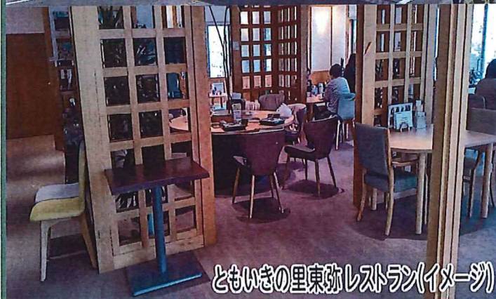
ともいきの里東弥レストラン(イメージ)