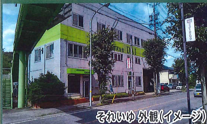
それいゆ 外観(イメージ)