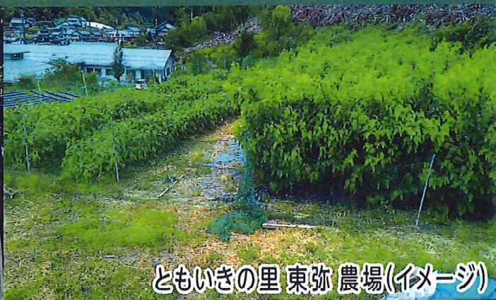
ともいきの里 東弥 農場(イメージ)