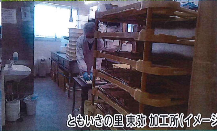
ともいきの里 東弥 加工所(イメージ)