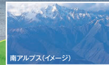
南アルプス (イメージ)