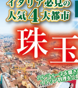
5日目 イメージ 世界遺産 パチカン市街 サンピエトロ寺院 15~16世紀のイタリルルネサンスを体感する花の都。ドッオーモを中心に、由緒が長いサンピエトロ寺院を巡ります。