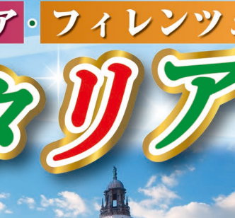
7日目 イメージ 世界遺産 ベネチア 4世紀からドリア海軍基地の干洲に発達した都。数々の運河や水がゆめがたく美しく、1%の都です。