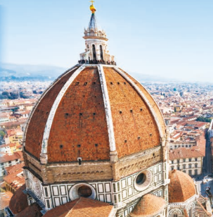
4日目 イメージ 世界遺産 歴史地区 15~16世紀のイタリルルネサンスを体感する花の都。ドッオーモを中心に、由緒が長いサンピエトロ寺院を巡ります。