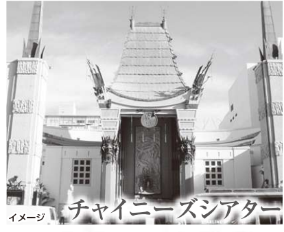
イメージ チャイニーズシアター