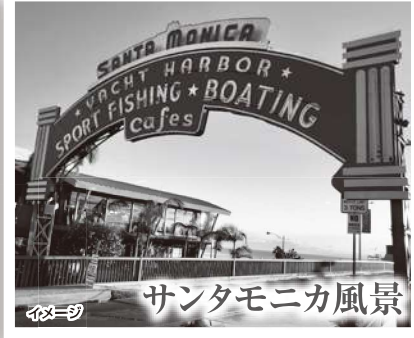
イメージ サンタモニカ風景