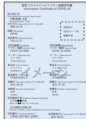
「ワクチン接種証明書」