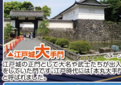
▲江戸城大手門 江戸城の正門として大名や武士たちが出入りをしていた門です。江戸時代には「本丸大手門」と呼ばれました。