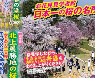
弘前城の桜と岩木山