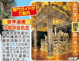
世界遺産 中尊寺金色堂

旅のポイント 1 東北新幹線と貸切バスを利用して、個人では行き難い、みちのく三大桜、日本大桜のつ三春の滝桜、さくら100年の鶴ヶ城と豊城の桜を巡ります。