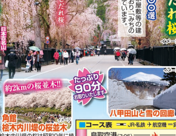
お花見学者教 日本一の桜の名所!!