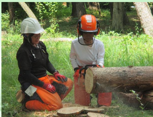
チェーンソーの操作体験