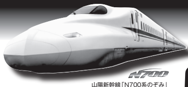
山陽新幹線「N700系のぞみ」