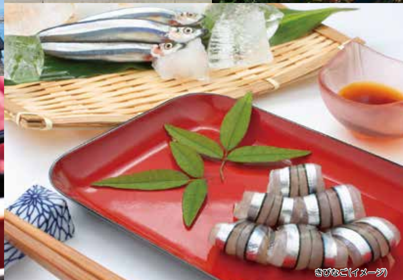
きびなご(イメージ)