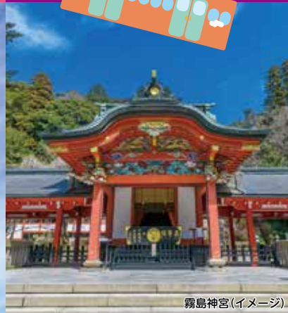
霧島神宮(イメージ)