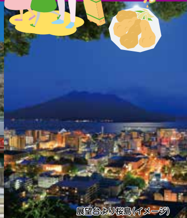
展望台より桜島(イメージ)