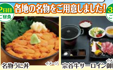
名物うに丼 宗谷牛サーロイン御膳

礼文島: 地蔵岩と元地海岸 地蔵岩は、高さ50mの奇岩です。元地海岸では、まれにメノウの原石を拾うことができます。