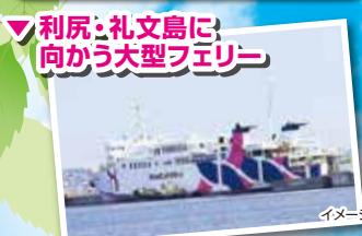
利尻・礼文島に！向かう大型フェリー