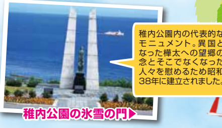
稚内公園の氷雪の門

稚内公園内の代表的なモニュメント。異国と似た樺太への望郷の念とそこでなくなった人々を慰めるため昭和38年に建立されました。