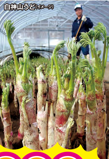
白神山うど(イメージ)