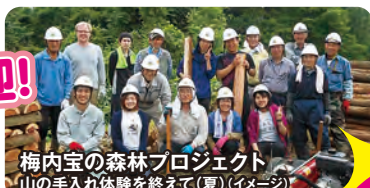
梅内宝の森林プロジェクト 山の手入れ体験を終えて (夏) (イメージ)