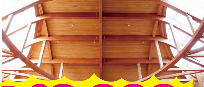
木高研 木材を使用した建築 (イメージ)