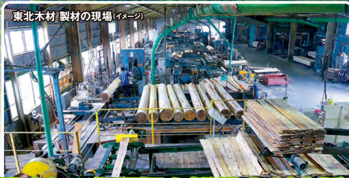
東北木材 製材の現場 (イメージ)