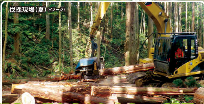
伐採現場(夏) (イメージ)