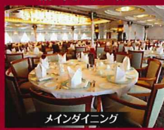
メインダイニング