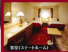
客室(ステートルーム)