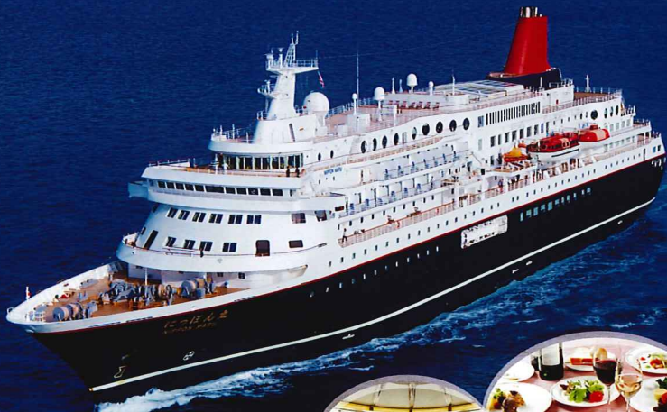
イメージ