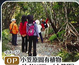
OP 小笠原固有植物 ガイドツアー(小笠原)